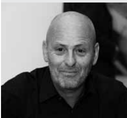
RUINELLI ASSOCIATI ARCHITETTI