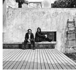
NERI & HU DESIGN AND RESEARCH OFFICE

Fondato nel 2004 da Lyndon Neri e Rossana Hu, Neri&Hu Design and Research Office è uno studio di architettura multidisciplinare con base a Shanghai, Cina. Neri&Hu lavora a scala internazionale su progetti di architettura, interior design, masterplan, grafica e disegno industriale. Con progetti in corso in otto Paesi, Neri&Hu è composto da uno staff multiculturale che parla più di 30 lingue. La diversità del gruppo rinforza una visione centrale dello studio, ovvero rispondere a una vista globale del mondo che incorpora discipline di design che si sovrappongono in un nuovo paradigma di architettura. Neri&Hu è stato pubblicato dalla stampa di tutto il mondo e i soci fondatori Lyndon Neri e Rossana Hu sono stati selezionati rispettivamente come uno dei "I. D. Magazine I.D. Forty" e uno dei "40 under 40 prominent designers shaping Hong Kong and Greater China".